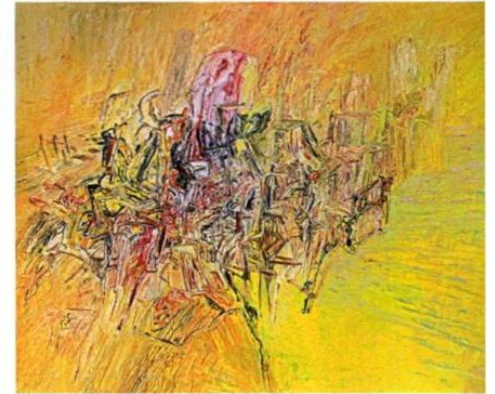
"Uzak", yağlıboya, 2013.

"Şehir adeta yapıldıkça çürüyen bir bir karkas gibi" diyen Mehmet Gülerüz İstanbul'un üzerinde Demokles'in kılıcı gibi sallanan deprem tehlikesini ironik buluyor. Sanki İstanbul üstüne kurulu şehri üzerinden söküp atmakla tehdit ediyor sakinlerini.